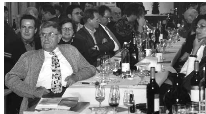
Das interessierte Auditorium

Die in diesem Sinne radikalste Auseinandersetzung mit dem Begriff Terroir findet sich in den Schriften des französischen Philosophen Michel Onfray. Dieser erläutert ihn am Beispiel des Sauternes, speziell Château d'Yquem. Er sieht in diesem Begriff eine Art Gedächtnis im Wein, historisch und metaphysisch zugleich, eine Form der Zeit. Einerseits gebunden an den Ort der Erzeugung, seine ganze Geschichte