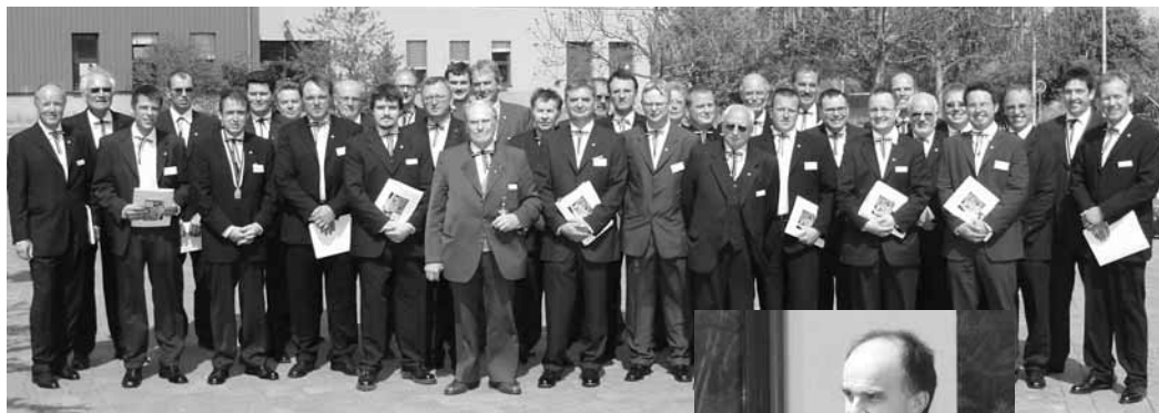
Die „Neuen“ mit ihren Paten