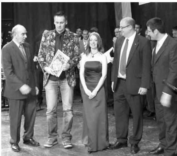
Bei der Preisverleihung des Ehrenpreises der Weinbruderschaft Rheinhessen an das Weingut Gysler aus

Preisträger der letzten 30 Jahre bestätigen die Weinbruderschaft in ihrem Wirken.