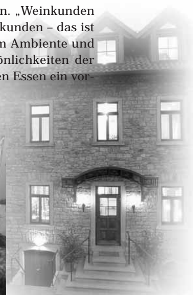
Heike und Wilfried Espenschied (2. u. 4. von links) zeigen mit ihrem Espenhof in Flonheim-Uffhofen, dass Wein, Landschaft und Tourismus begünstigend aufeinander wirken.